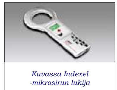
Kuussa Indexel -mikrosirun lukija

Varaa lukijat hyvissä ajoin puhelimitse ja kerro samalla seuraavat tiedot: Tapahtuman järjestäjä ja päivämäärä